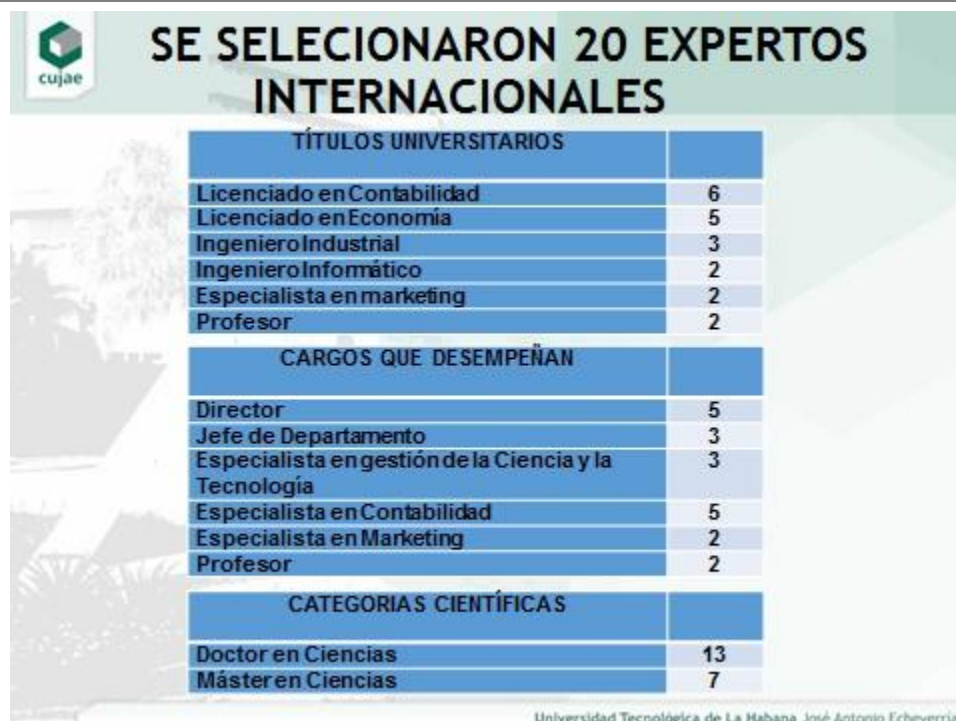
Figura 3. Características de los expertos seleccionados

Se aplicó un instrumento para recibir la valoración de los expertos sobre los diferentes aspectos del procedimiento propuesto con los siguientes resultados: