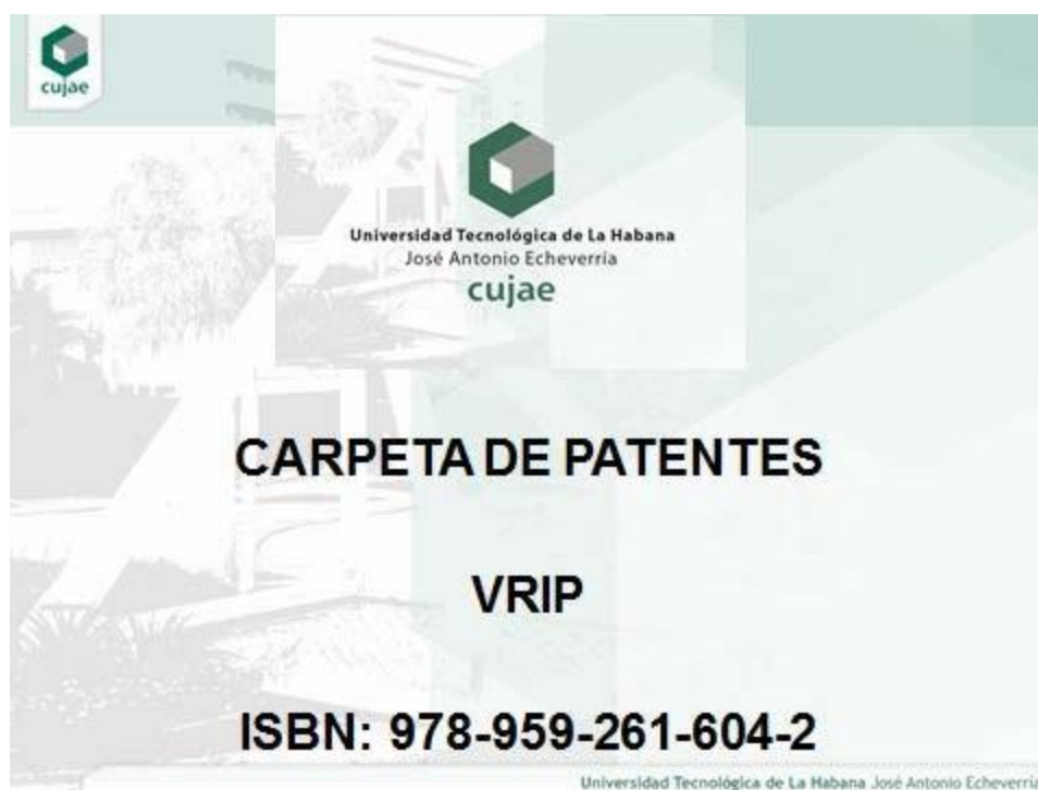
Figura 2. Portada de la carpeta de patentes de la universidad

La carpeta de patentes (Figura 2) se confeccionó sobre la base de la búsqueda de las patentes reconocidas internacionalmente para el Instituto Superior Politécnico José Antonio Echeverría, Cujae, hoy Universidad Tecnológica de La Habana José Antonio Echeverría, Cujae, encontrándose el reporte de 79 patentes obtenidas por nuestra universidad en los últimos 44 años (1976-2020).